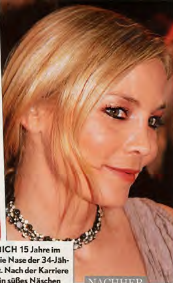
REGINA HALMICH 15 Jahre im Boxring haben die Nase der 34-Jährigen gezeichnet. Nach der Karriere gönnte sie sich ein süßes Näschen